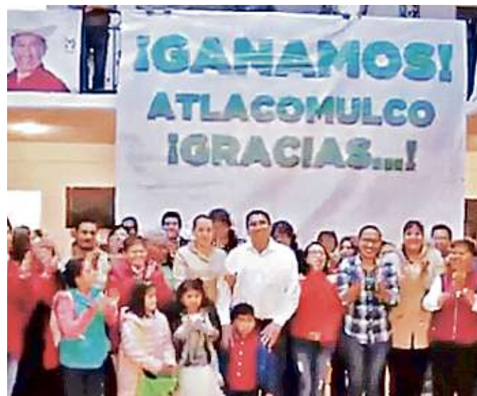
Morena ganó el municipio de donde es el Presidente Peña.

diputaciones federales que estuvieron en juego, apenas logró 15 distritos de mayoría en demarcaciones de Yucatán, San Luis Potosí, Zacatecas, Nuevo León, Chiapas y el Estado de México.