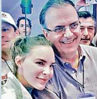
Tomada de Twitter @belindapop

@m_ebrard qué gran acierto tu nombramiento como próximo Canciller de México e integrante del equipo de transición del próximo gobierno del Presidente @lopezobrador_ estoy segura que desempeñarás el mejor papel. Mucho éxito y gracias por tu confianza y apoyo!